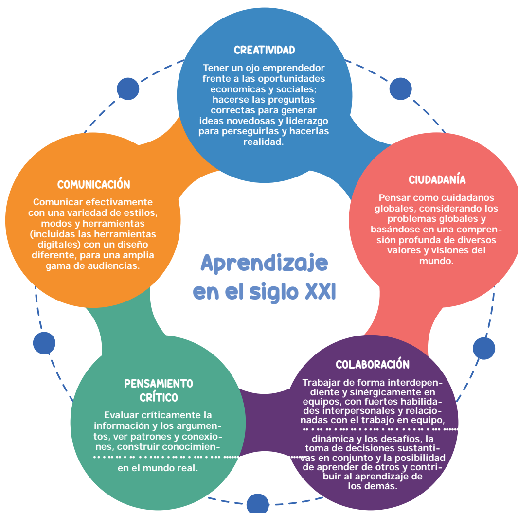
Gráfico 2. Priorización del conjunto de habilidades propuestas desde la mirada de las habilidades del siglo XXI 6CS