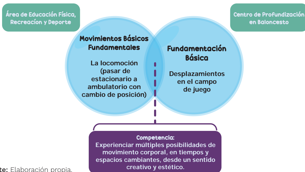
Gráfico 6. Ejemplo de una relación de contenidos del área de EFRD y los centros de profundización

Hay diferentes maneras de relacionar los contenidos del área y lo abordado en el Centro de Profundización, una es cruzar los contenidos de uno y otro espacio a fin de generar una competencia a desarrollar, tal y como se muestra en la siguiente figura: